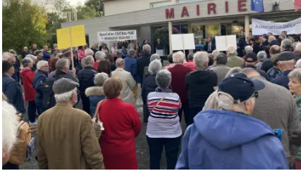
Mignaloux-Beauvoir : plus de 200 personnes pour dire non au tracé de Grand Poitiers