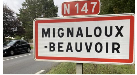
Contournement de Mignaloux-Beauvoir : Grand Poitiers s'explique