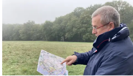
Vienne : les opposants au projet de contournement de Mignaloux passent à l'action